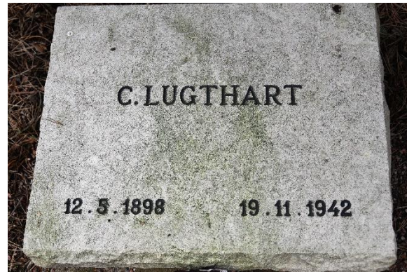
Graf op het Nationaal Ereveld Loenen

Op 29 oktober 1992 vond hij zijn laatste rustplaats op het Ereveld in Loenen. 18)