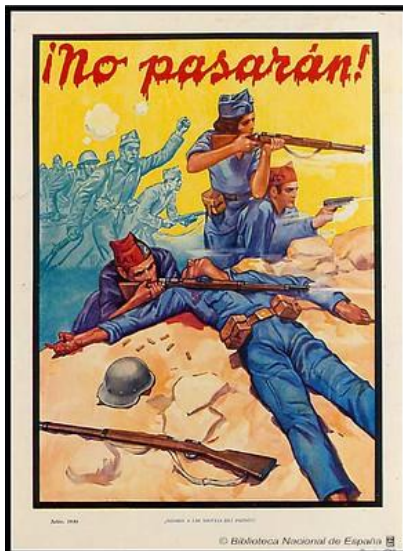
Biblioteca Nacional de España; Confederación Nacional del Trabajo (España);1936. Zie voor de rechten blz. 12.

In december 1936 zamelde Voorst, waar op dat moment geen afdeling van de Internationale Rode Hulp was, 43 mud aardappelen, vijf zaken knolrapen en acht kilo bruine bonen in voor de Spaanse Republiek. Bovendien werd er in een maand tijd voor fl. 9,- aan Spanjebonnen verkocht.